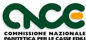
TABELLA CODIFICHE APPRENDISTATO V2 (21/05/2019) CCNL INDUSTRIA E COOPERAZIONE (accordo 4 aprile 2019)

Con la presente tabella sono fornite le nuove codifiche applicabili ai profili introdotti dall'accordo industria e cooperazione del 4 aprile 2019. A tale accordo deve essere fatto riferimento per quanto non indicato dalla presente tabella. Le vecchie codifiche saranno applicate fino al termine di ultimazione dei rapporti di lavoro precedentemente sottoscritti.